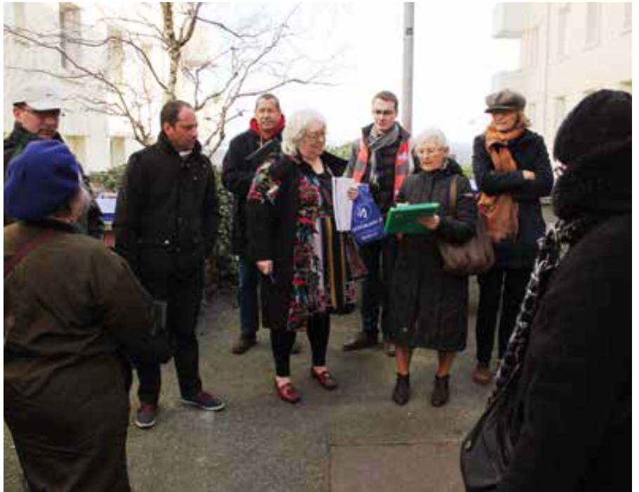
→ Les ateliers participatifs « Avec Vous » permettent d'évoquer ensemble sur site différentes thématiques liées à votre habitat et à votre cadre de vie.

Tous les deux ans, l'Office mesure la satisfaction des locataires avec une enquête téléphonique auprès d'un échantillon représentatif de 1 500 personnes, choisies en fonction de leur type d'habitat, la localisation, la composition familiale, les conditions de ressources. Cette enquête, réalisée l'été dernier par un cabinet indépendant, comporte 51 questions et aborde toute thématique liée à votre habitat : qualité des logements, parties communes, isolation, espaces verts, qualité des services de proximité... Et, pour 84 % d'entre vous, vous êtes satisfaits de l'Office, acteur public du logement social sur la Métropole.