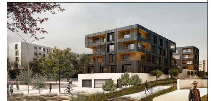
002 4 PIÈCES RDC