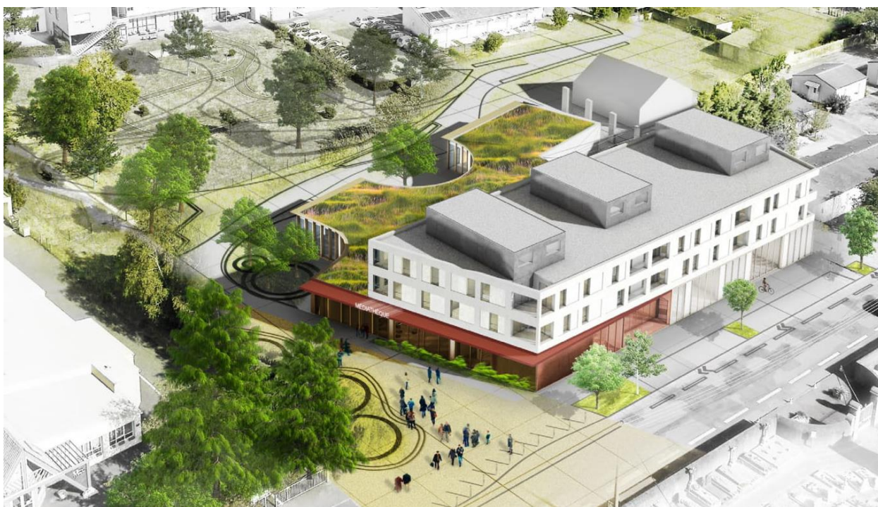
© projet : Tetrarc / image : Atelier Arnaud Sabatier