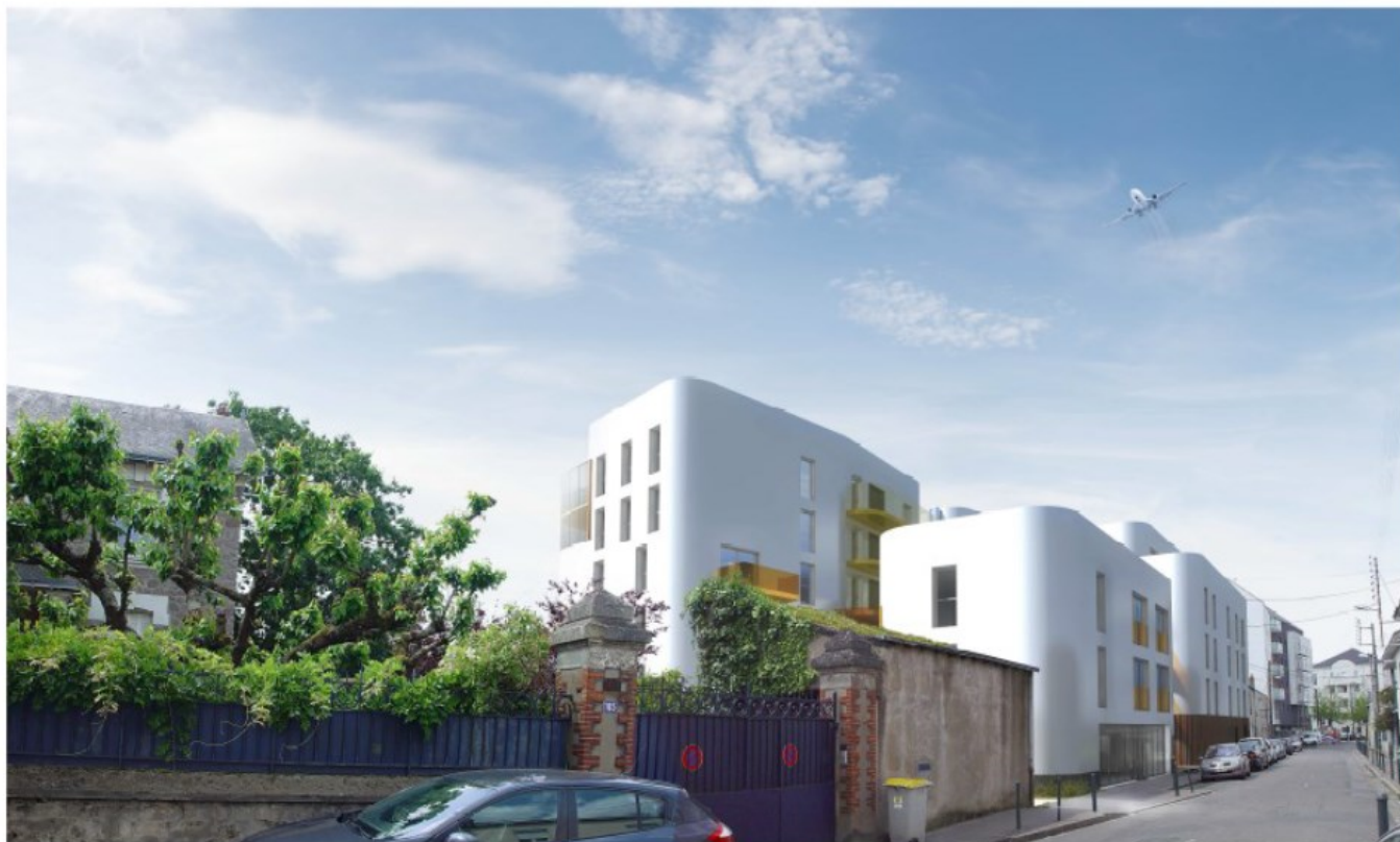
> Vue depuis la rue de la Convention